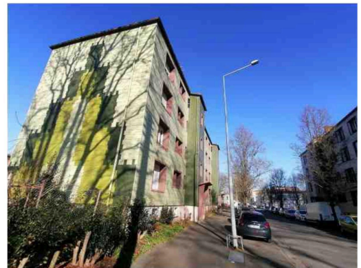
En bas de la rue Pierre-Loti à Rochefort, les deux immeubles qui se font face feront l'objet de travaux à partir de mars, avril et mai 2025.